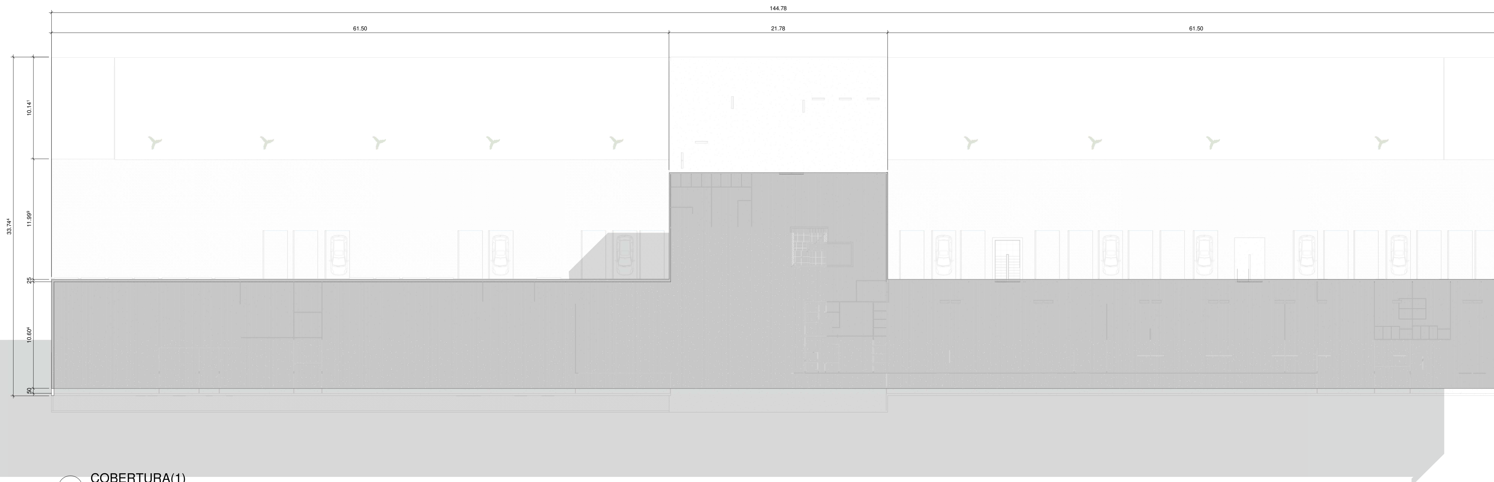
1 COBERTURA(1) 1:200